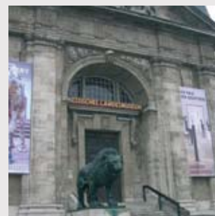
Eingang des Hessischen Landesmuseums