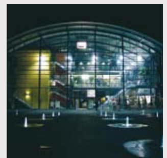
Neubau des Hauptbahnhofs bei Nacht