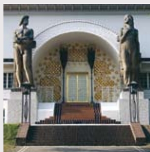
Jugendstil am Museum Mathildenhöhe