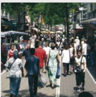
Einkaufsstraße in Darmstadt-Innenstadt