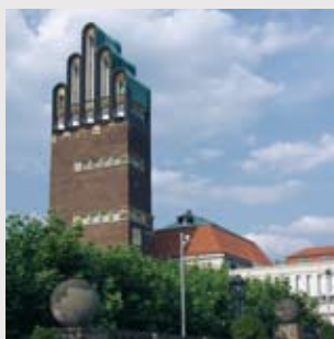
Fünffingerturm (Hochzeitsturm) auf der Mathildenhöhe