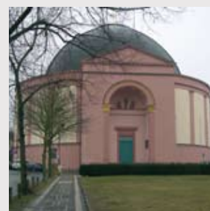
Katholische Kirche St. Ludwig