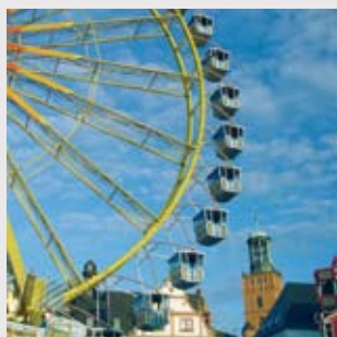
Riesensrad auf dem Heinerfest