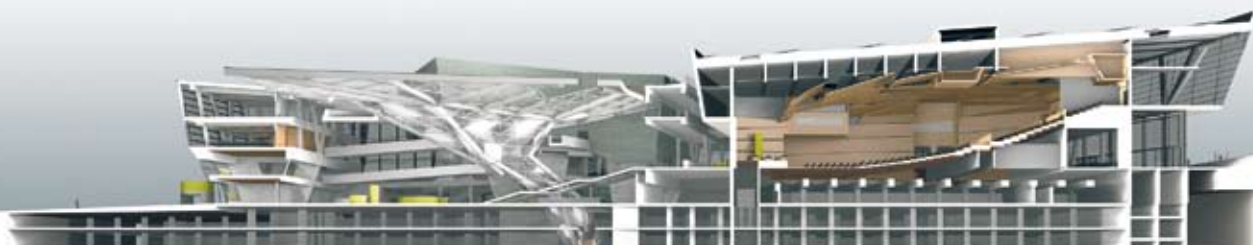
Darmstadtium – das Konferenzzentrum der BUKO 2009.