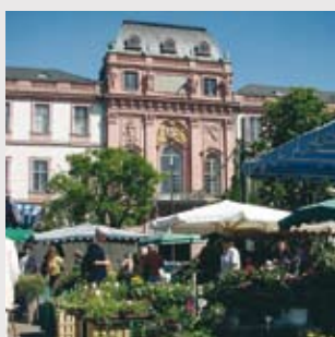
Markt vor dem Schloss

Couponing- Heft mit speziellen Angeboten für jeden angemeldeten Teilnehmer, Gewinnspiel- / Verlosungen auf den Konferenzpromotions vor Ort.